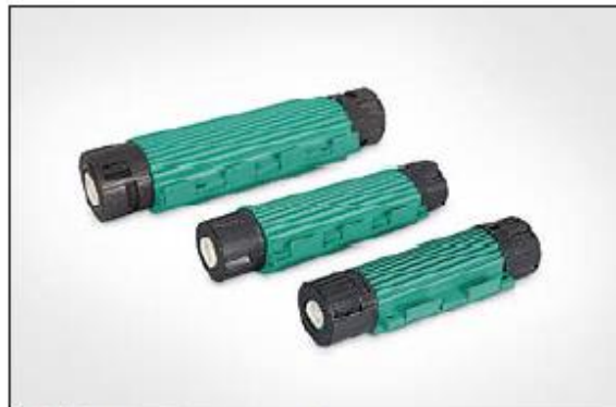
Gel kabelskjøt Reliseal, leveres i tre størrelser.