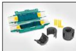
Gel kabelskjøt Reliseal V56.