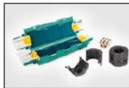
Gel kabelskjøt Reliseal V525.