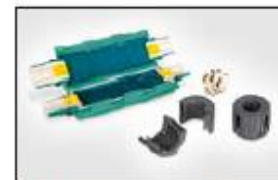
Gel kabelskjøt Reliseal V510.